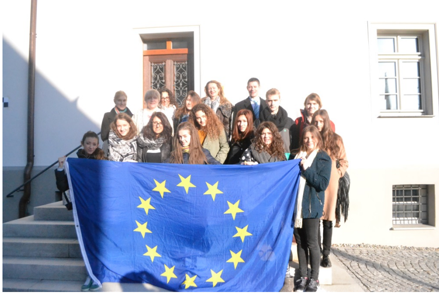
Latvijas un Itālijas projekta dalībnieki pēc tikšanās ar Altshauzenes pilsētas mēru.