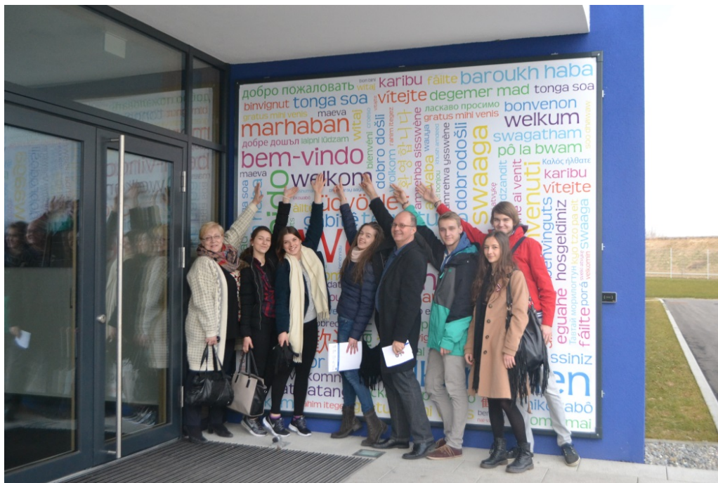
Pie uzņēmuma "Stadler" galvenās ražotnes.