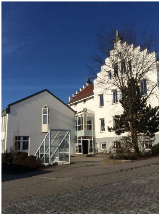
Vācijas partnerskola - Altshauzenes progimnāzija.