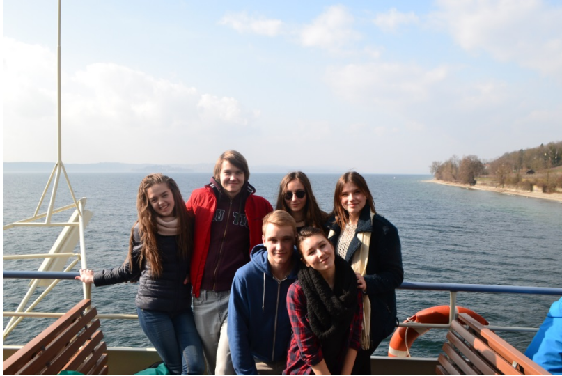
Latvijas projekta dalībnieki ceļā uz Konstancas universitāti.