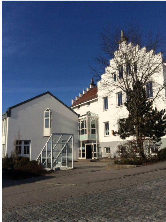
Vācijas partnerskola-Altshauzenas progimnāzija