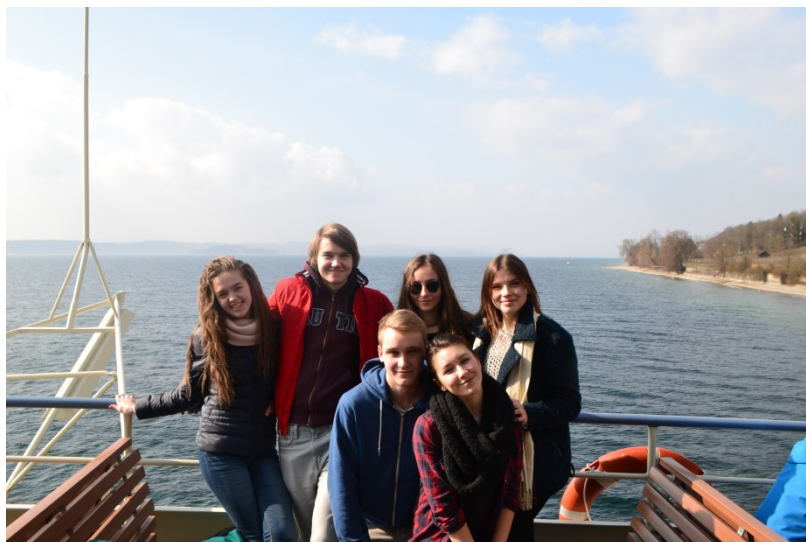
Latvijas projekta dalībnieki ceļā uz Konstances universitāti