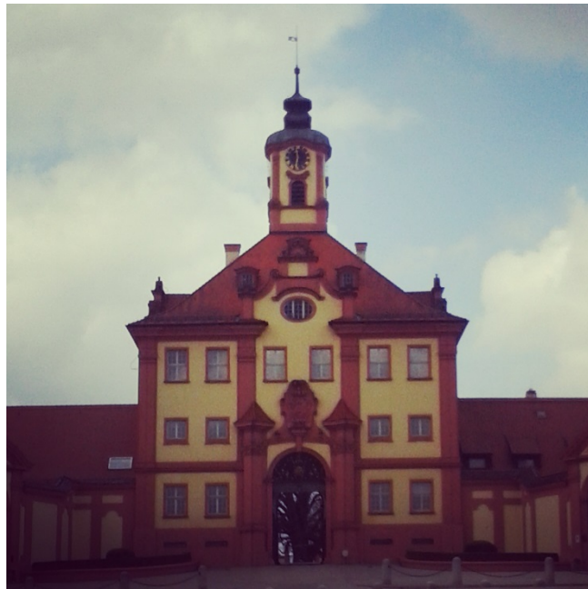
Altshauzenas pils blakus partnerskolai