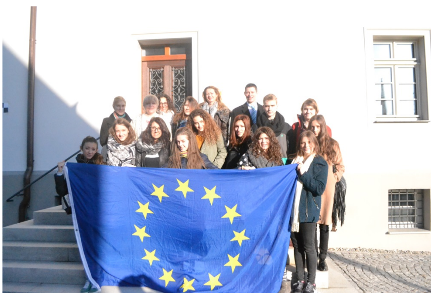
Latvijas un Itālijas projekta dalībnieki pēc tikšanās ar Altshauzenas pilsētas mēru