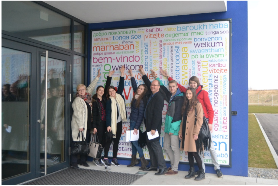
Pie uzņēmuma "Stadler" galvenās ēkas