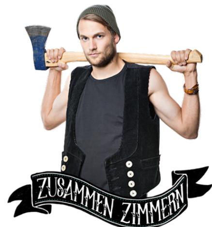
Ein muskulöser Zimmererlehrling.

Obwohl ich finde, dass sich der Beruf echt spannend und vielseitig anhört, und der Test auf der Website www.z-wie-zimmerer.de ergibt, dass ich perfekt für den Beruf geeignet bin, bin ich mir ziemlich sicher, dass ich keine Zimmerin werde, da ich in Mathe und Physik zu unbegabt bin.