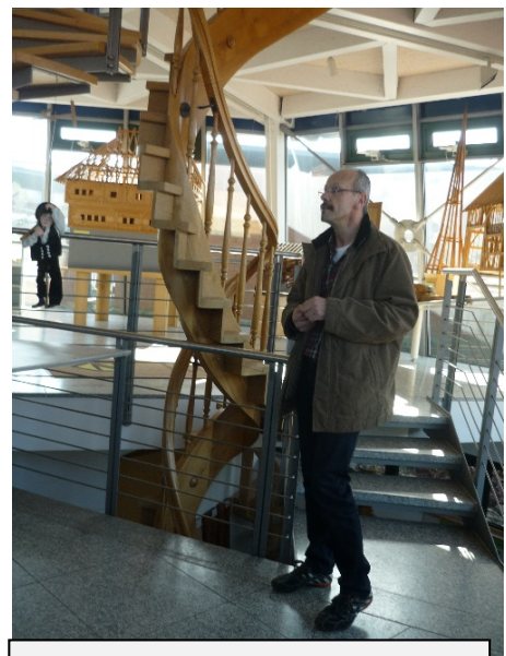
Am Anfang unserer Führung im gläsernen Ausstellungsturm.

In Ruhe ließen wir unseren Besuch in der Lehrlingswerkstatt der Zimmerer dann in der Sonne nach einem Gruppenbild mit den Erasmus-Gästen ausklingen.