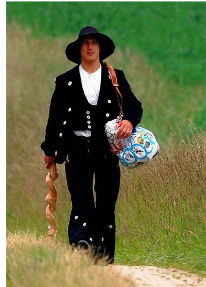
Ein Zimmerergeselle auf der Walz; gut zu sehen ist die Kluft.

Ihr Erkennungszeichen ist die berufstypische, schwarze Zimmererkluft. Dazu gehören die Zimmererstiefel, ein schwarzer Hut, eine weite Schlaghose aus Cord und die traditionelle Weste. Um den Hals tragen sie ein krawattenähnliches blaues Kleidungsstück – die sogenannte Ehrbarkeit. Auf der Walz müssen sie die Kluft tragen und dürfen den Hut nicht abnehmen (außer zum Essen, Duschen, Schlafen und in der Kirche). Das alles ist wichtig, denn durch diese Erscheinung können die Mitmenschen sie sofort als wandernden Gesellen erkennen. So weiß jeder, dass sie auf der Suche nach Arbeit sind oder eine Mitfahrgelegenheit, einen Schlafplatz, vielleicht auch eine Mahlzeit benötigen.